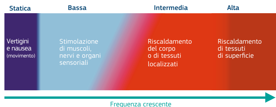
Figura 2.1 — Effetto dei campi elettromagnetici con diverse gamme di frequenza (gli intervalli di frequenza non sono in scala)

Questi concetti sono illustrati nella figura 2.1.